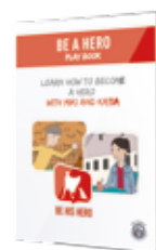
Βιβλίο με παιχνίδια