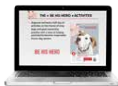
Παρουσίαση για δασκάλους