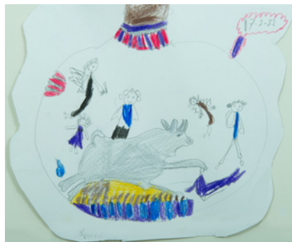
Χριστίνα Κουτσούμπα 1ο Δημοτικό