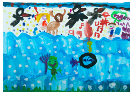
Γεωργία Γκόκου 2° Δημοτικό