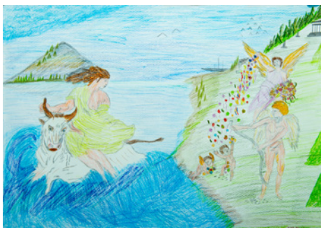
«Κοινωνία Ίσων Ανθρώπων»

Ο σκοπός της δραστηριότητάς μας είναι οι εκπαιδευόμενοι να διερευνήσουν και να καταγράψουν τα έργα διάσημων καλλιτεχνών που συνδέονται με γνωστές ή άγνωστες τοποθεσίες, στις οποίες κατοικούσαν, ή από τις οποίες κατάγονταν ή αγαπούσαν να επισκέπτονται. Κάποιες από αυτές τις τοποθεσίες είναι γνωστοί τουριστικοί προορισμοί, όπως το Λονδίνο, το Παρίσι και άλλα μέρη της Ευρώπης, τα οποία ενέπνευσαν πολλούς καλλιτέχνες να δημιουργήσουν φημισμένα έργα. Οι εκπαιδευόμενοι θα αναλύσουν την τεχνική που χρησιμοποιεί ο κάθε καλλιτέχνης στο έργο του, τα μέσα και τα υλικά που χρησιμοποίησε, καθώς και το μέγεθος του πίνακα/έργου. Επίσης θα αναλυθούν οι καλλιτεχνικές και άλλης φύσεως επιρροές που είχε ο κάθε καλλιτέχνης, ώστε να δημιουργήσει το συγκεκριμένο έργο για μια τοποθεσία. Το video θα έχει διανθιστεί από Ευρωπαϊκή μουσική.