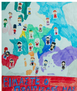
Τάσος Σκούτας 1ο Δημοτικό

Προβολή βίντεο με έργα των μαθητών για την υπεράσπιση της ειρήνης. Πρόκειται για μια σύνθεση επιμέρους δράσεων, με σκοπό τη μελέτη των εννοιών του πολέμου και της ειρήνης και την ενδυνάμωση, σε επίπεδο πρόληψης ή/και διαχείρισης, αρνητικών συναισθημάτων από τον πόλεμο στην Ουκρανία. Μέσω αυτής, προσεγγίζεται το ζήτημα της ανθρωπιστικής κρίσης, ευαισθητοποιώντας τους μαθητές και θέτοντας τις βάσεις καλλιέργειας κουλτούρας αλληλοβοήθειας/αλληλεγγύης και καθολικών αξιών που μας συνδέουν ευεργετικά σε κάθε εμπόλεμη, προσφυγική ή άλλη κρίση.