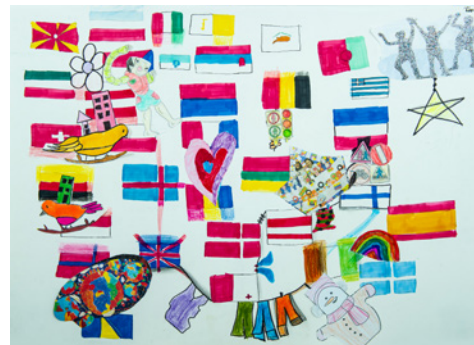
Έρικα Χασανάι 21ο Δημοτικό