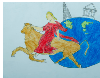
Νικολέτα Φασουλάρη 1ο Γυμνάσιο