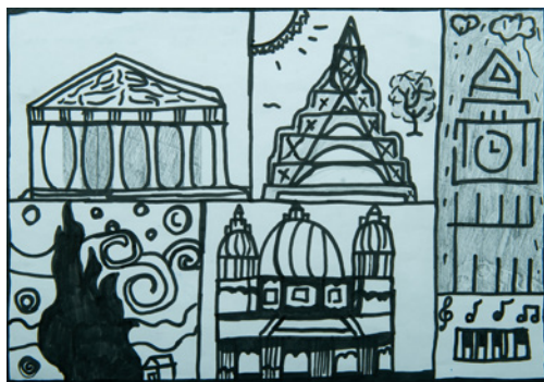
Δημήτρης Μιχαλός 1ο Δημοτικό