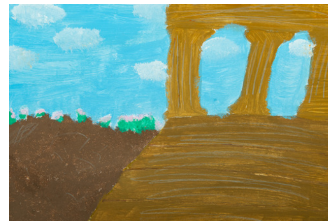
Υακίνθη Κατσικάδη 14ο Γυμνάσιο