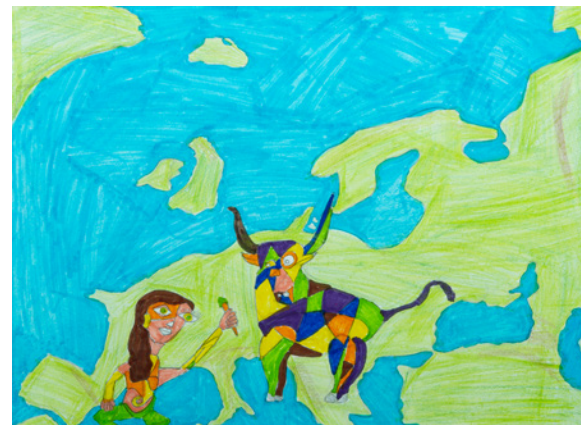
Κυριάκος Σαλονικίδης 14ο Γυμνάσιο

Οι μαθητές και μαθήτριες του 13ου Γυμνασίου Καλλιθέας.