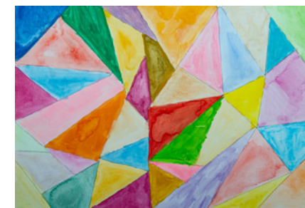
Μ. Καββαδά Φ. Κατσέλη Α. Κατσέλη