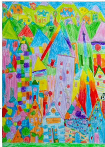
Z.- A. Βόμπρα Μ. Γκότζια